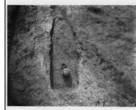
사진 6. 도량묘 조사 후 전경